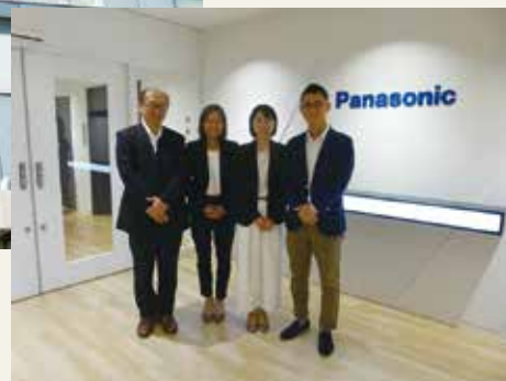
経理業務本部の皆様